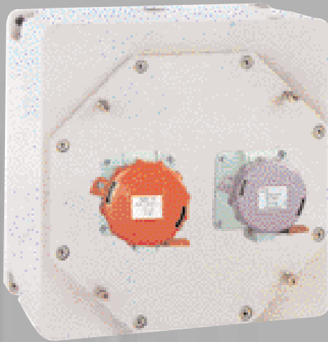
Coffret IIC aluminium équipé d'1 socle 3P+T 380/415V et 1 socle TBT 2P+T20/25V

Pour répondre à tous vos besoins d'installations, ATX propose une gamme complète de prises encastrables en Très Basse Tension et Basse Tension en 16 et 32 A et en 24 V, 110 V, 220V, 380 V, 500 V.