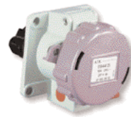
Socle encastrable 0944 25