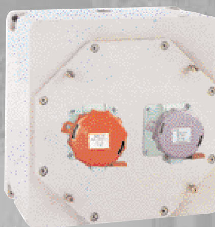
Coffret IIC aluminium équipé de 1 socle 3P+T 380/415V et 1 socle TBT 2P+T20/25V